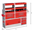
5006 C4 - Assortimento lato sinistro