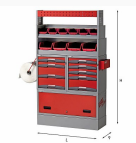
5006 E9 - Assortimento lato destro