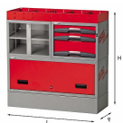
5006 EF6 - Assortimento lato sinistro